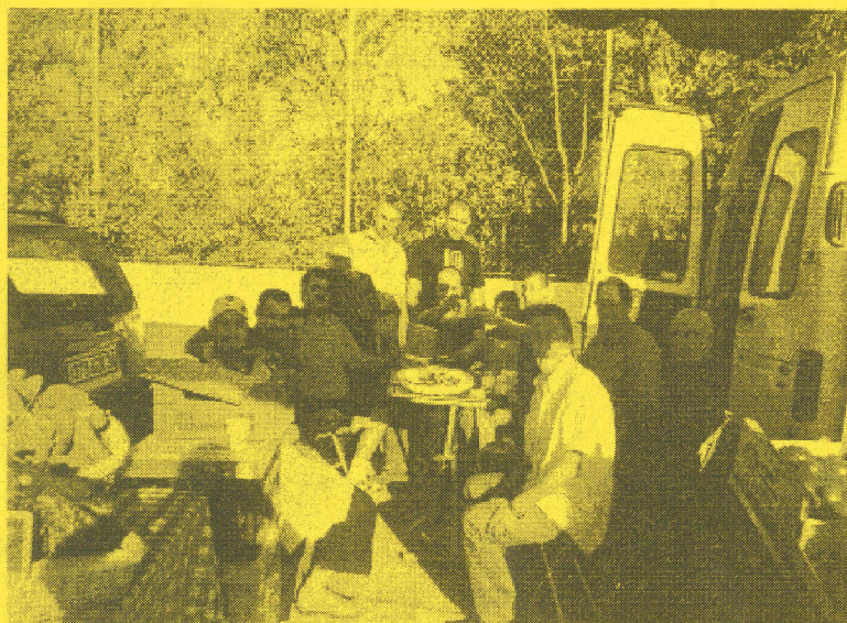
L'inévitable casse-croûte du dimanche matin en attendant que les clients... se réveillent !

Les commerçants du marché dominical vous remercient de votre confiance et de votre fidélité et vous présentent tous leurs Meilleurs Voeux pour cette nouvelle année 2008